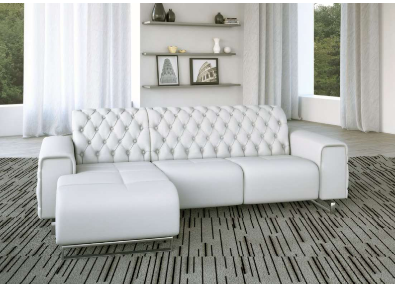
IN FOTO: RIVESTIMENTO IN PELLE; INSERTI BOTTONI SWAROSKY (a richiesta); PIEDI IN ACCIAIO.