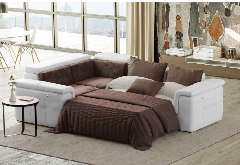
IN FOTO: DOPPIO RIVESTIMENTO IN PELLE E TESSUTO; PIEDI IN LEGNO CON BORDO IN ALLUMINIO.