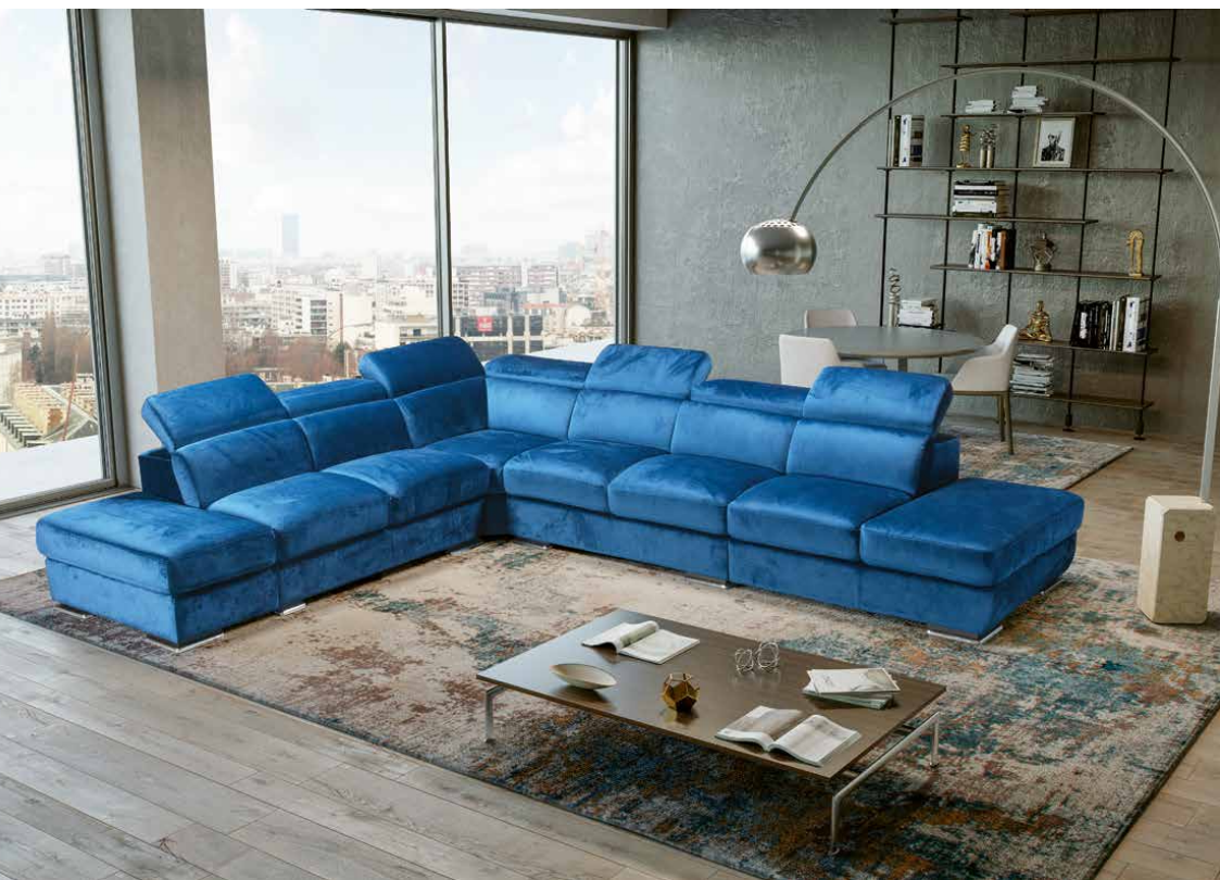
IN FOTO RIVESTIMENTO IN TESSUTO; PIEDI IN LEGNO CON BORDO IN ALLUMINIO.