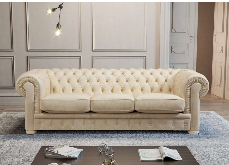
IN FOTO: RIVESTIMENTO IN PELLE; PIEDI IN LEGNO (rivestiti in pelle a richiesta).